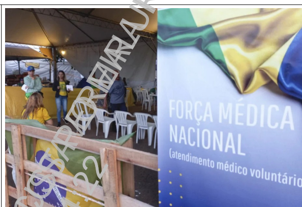
Tenda da autodenominada "força médica nacional", oferecendo serviço de atendimento de saúde