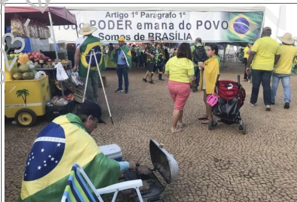
“Todo PODER emana do POVO”: a pretexto de reproduzir texto da CF, incita as Forças Armadas contra o Poder Judiciário.

No mesmo sentido, faixas hostilizando Ministros do Supremo Tribunal Federal 26 e/ou pedindo a “intervenção federal” 27 28 :