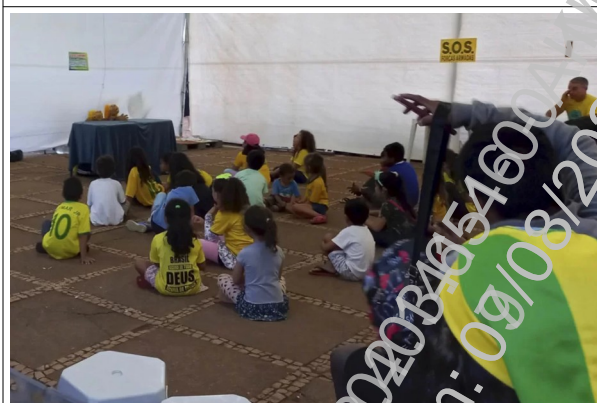
“S.O.S Forças Armadas”: incitação às Forças Armadas para tomada de poder.