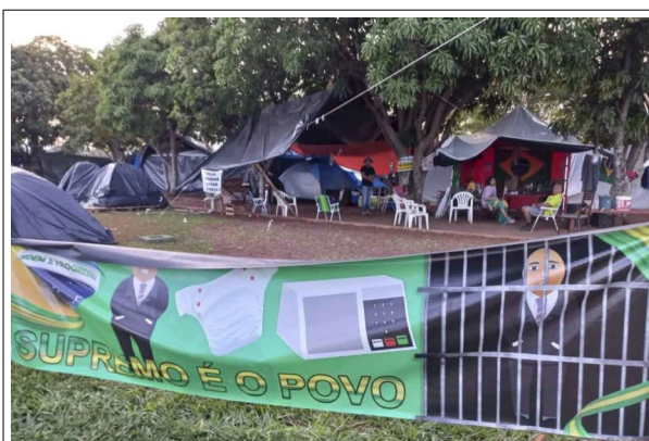
“Supremo é o povo”: incitação contra o Supremo Tribunal Federal, o Ministro Alexandre de Moraes e a segurança das urnas.