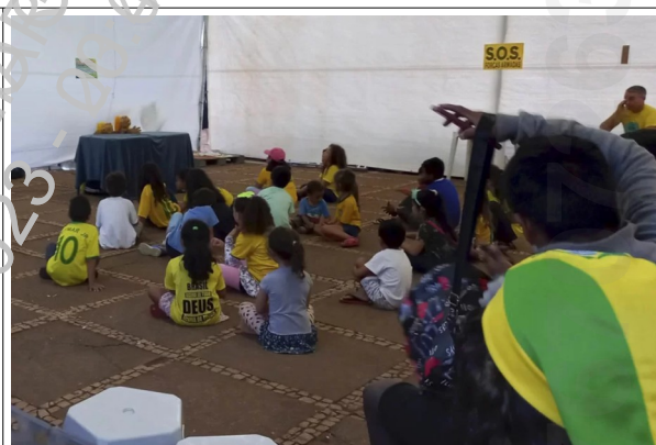
Teatro de fantoches