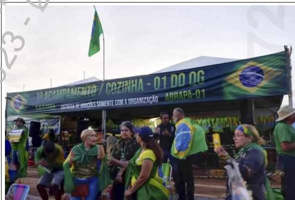
Tenda para recebimento de doações

É possível comprovar que no local também funcionavam tendas para churrasco, distribuição de comida e água e uma improvisada tenda religiosa 2 :