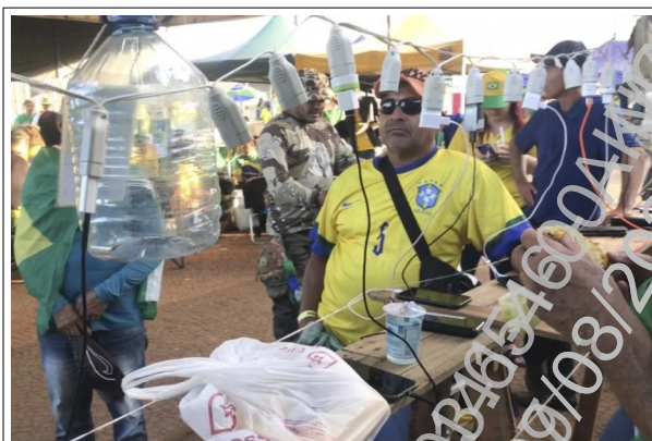
Ponto de carregamento de celular

A estabilidade e a permanência da associação formada por aqueles que acamparam em frente ao quartel são comprovadas, de forma clara, pela perenidade do acampamento, que já funcionava como uma espécie de vila, com local para refeições, feira, transporte, atendimento médico, sala para teatro de fantoches, massoterapia, carregamento de aparelhos eletrônicos, recebimento de doações, reuniões, como demonstram as imagens abaixo 1 :