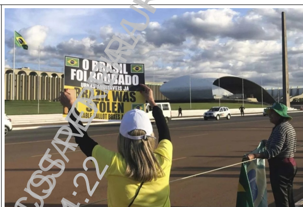
“O Brasil foi roubado: urnas auditáveis já”: incitação contra o Tribunal Superior Eleitoral.