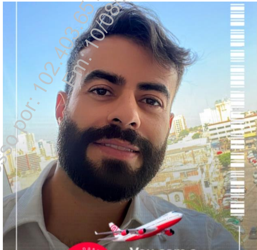
Figura 2 – Imagem de perfil associada ao usuário configurado no aplicativo WhatsApp Business