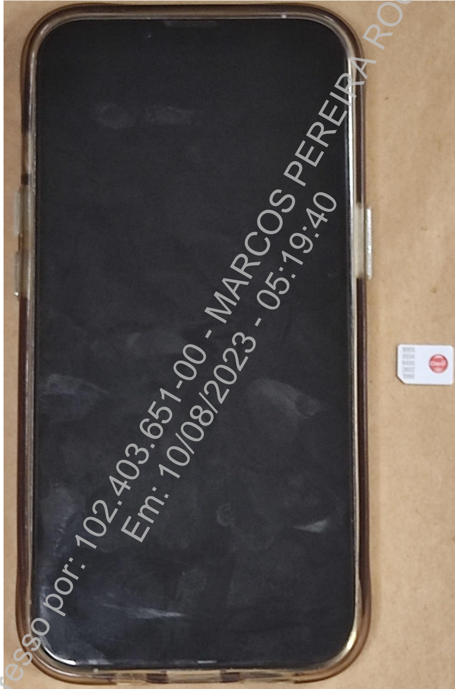
Fotografia 1 – Material examinado