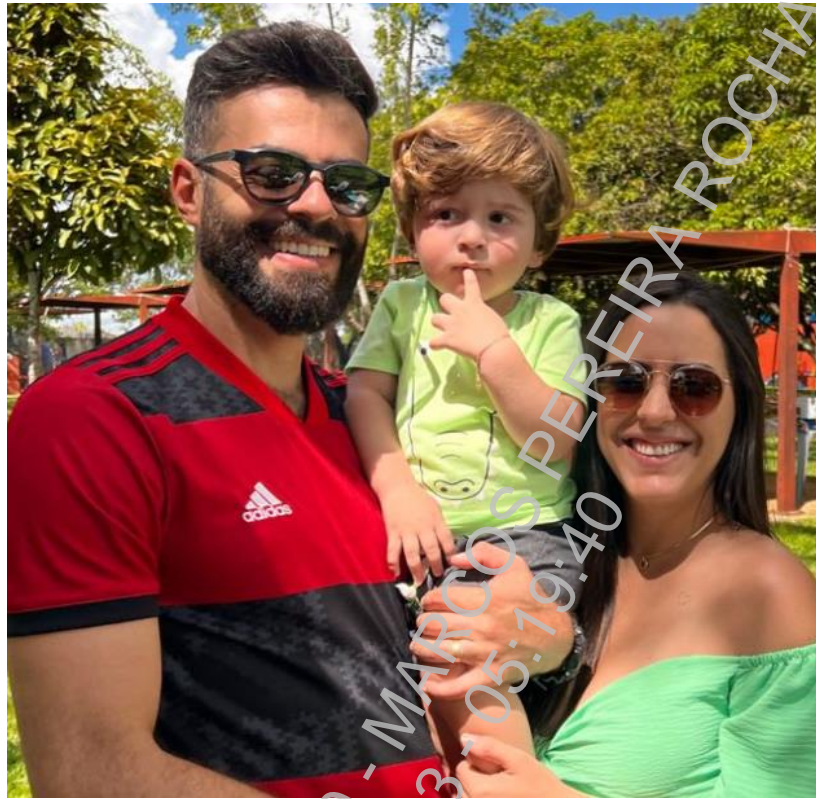
Figura 1 – Imagem de perfil associada ao usuário configurado no aplicativo WhatsApp