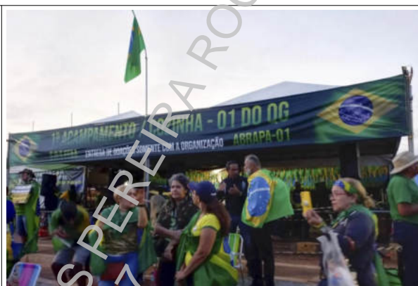
Tenda para recebimento de doações

É possível comprovar que no local também funcionavam tendas para churrasco, distribuição de comida e água e uma improvisada tenda religiosa 2 :