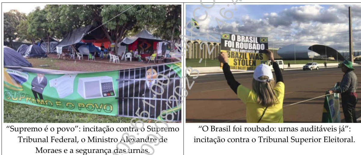
“Supremo é o povo”: incitação contra o Supremo Tribunal Federal, o Ministro Alexandre de Moraes e a segurança das urnas.

denunciada; 2.2) relatório descritivo, ilustrado com fotografias, do acampamento que se instalou nas imediações; 2.3) fluxo médio diário estimado de pessoas e, também por estimativa, informações a respeito da quantidade de pessoas ininterruptamente acampadas; 2.4) fotos, vídeos e relatórios descritivos do acampamento, a exemplo das imagens abaixo 24 :