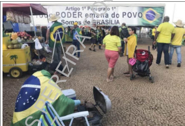
“Todo PODER emana do POVO”: a pretexto de reproduzir texto da CF, incita as Forças Armadas contra o Poder Judiciário.

No mesmo sentido, faixas hostilizando Ministros do Supremo Tribunal Federal 25 e/ou pedindo a “intervenção federal” 26 27 :