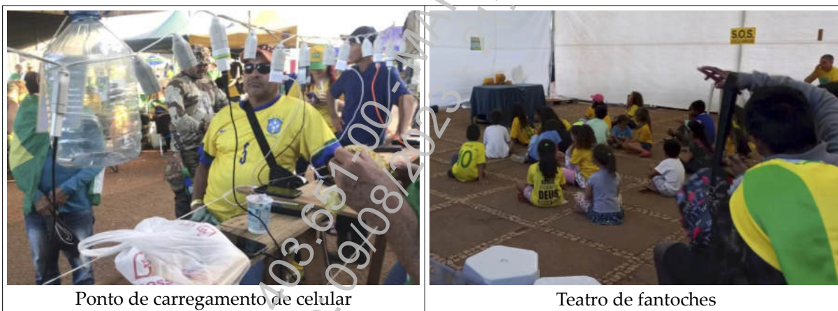
Ponto de carregamento de celular

A estabilidade e a permanência da associação formada por aqueles que acampam em frente ao quartel são comprovadas, de forma clara, pela perenidade do acampamento, que já funcionava como uma espécie de vila, com local para refeições, feira, transporte, atendimento médico, sala para teatro de fantoches, massoterapia, carregamento de aparelhos eletrônicos, recebimento de doações, reuniões, como demonstram as imagens abaixo 1 :