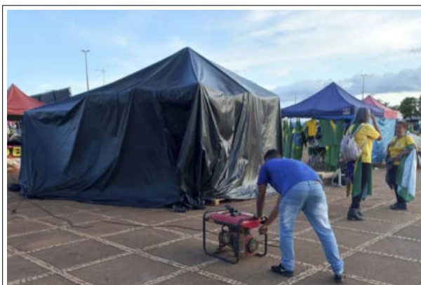
Gerador de energia