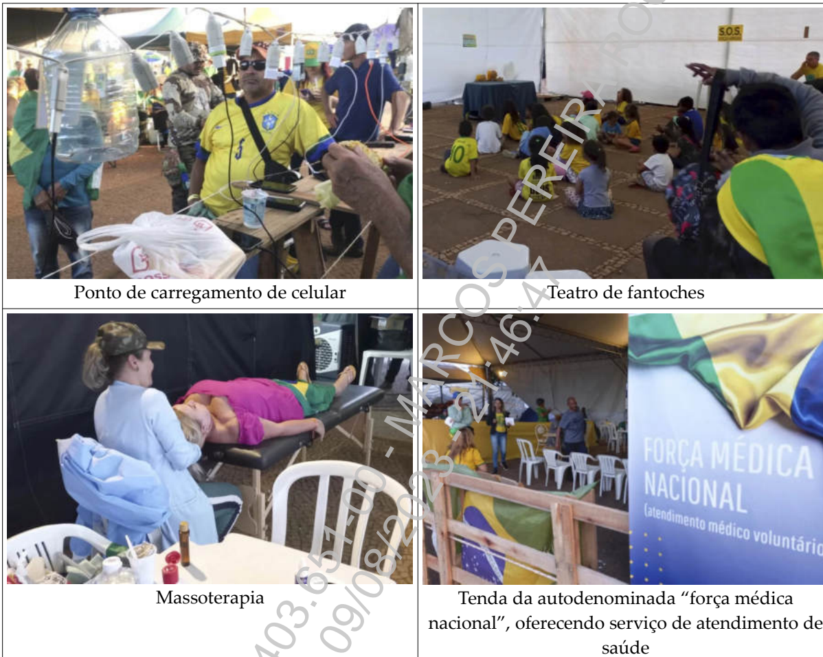
Ponto de carregamento de celular