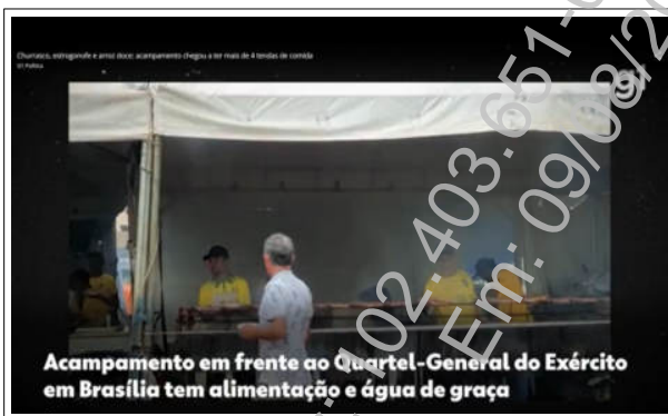
Acampamento em frente ao Quartel-General do Exército em Brasília tem alimentação e água de graça

É possível comprovar que no local também funcionavam tendas para churrasco, distribuição de comida e água e uma improvisada tenda religiosa 2 :