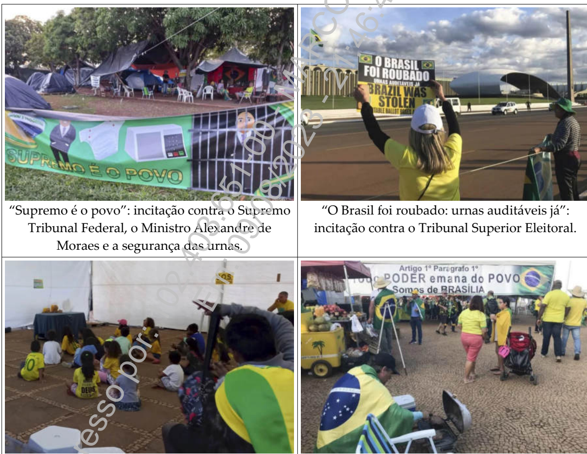
“Supremo é o povo”: incitação contra o Supremo Tribunal Federal, o Ministro Alexandre de Moraes e a segurança das urnas.

denunciada; 2.2) relatório descritivo, ilustrado com fotografias, do acampamento que se instalou nas imediações; 2.3) fluxo médio diário estimado de pessoas e, também por estimativa, informações a respeito da quantidade de pessoas ininterruptamente acampadas; 2.4) fotos, vídeos e relatórios descritivos do acampamento, a exemplo das imagens abaixo 24 :