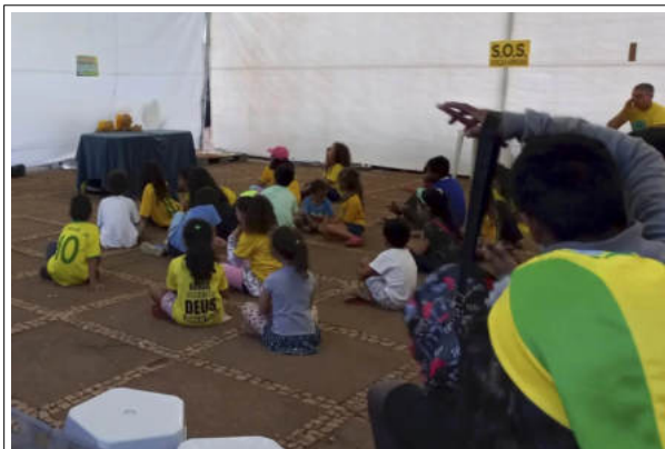
“S.O.S Forças Armadas”: incitação às Forças Armadas para tomada do poder.