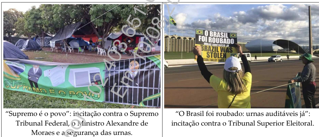
“Supremo é o povo”: incitação contra o Supremo Tribunal Federal, o Ministro Alexandre de Moraes e a segurança das urnas.