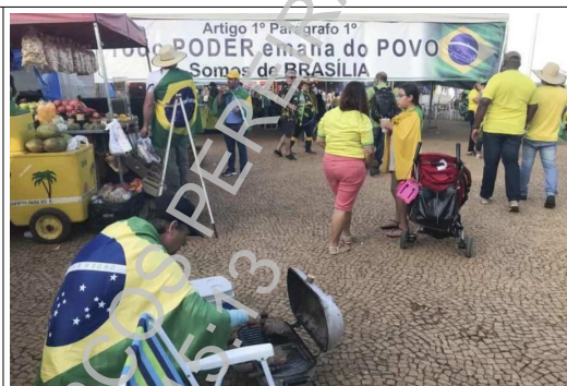
“Todo PODER emana do POVO”: a pretexto de reproduzir texto da CF, incita as Forças Armadas contra o Poder Judiciário.

No mesmo sentido, faixas hostilizando Ministros do Supremo Tribunal Federal 25 e/ou pedindo a “intervenção federal” 26 27 :