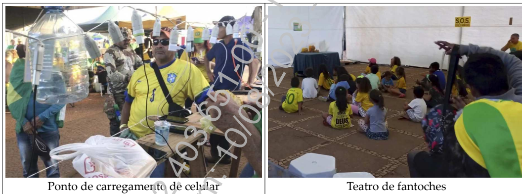
Ponto de carregamento de celular

A estabilidade e a permanência da associação formada por aqueles que acampam em frente ao quartel são comprovadas, de forma clara, pela perenidade do acampamento, que já funcionava como uma espécie de vila, com local para refeições, feira, transporte, atendimento médico, sala para teatro de fantoches, massoterapia, carregamento de aparelhos eletrônicos, recebimento de doações, reuniões, como demonstram as imagens abaixo 1 :