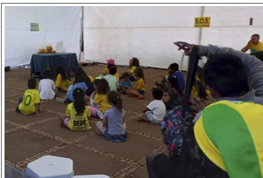
“S.O.S Forças Armadas”: incitação às Forças Armadas para tomada do poder.