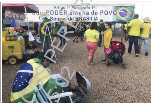
“Todo PODER emana do POVO”: a pretexto de reproduzir texto da CF, incita as Forças Armadas contra o Poder Judiciário.

No mesmo sentido, faixas hostilizando Ministros do Supremo Tribunal Federal 25 e/ou pedindo a “intervenção federal” 26 27 :