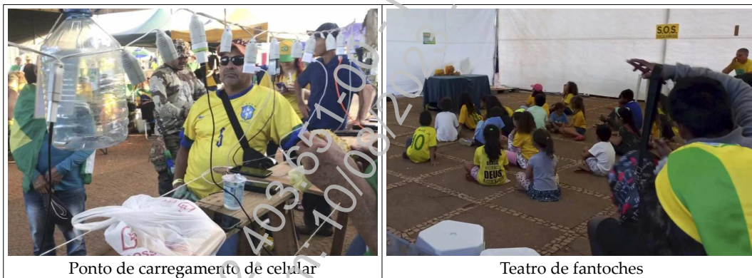
Ponto de carregamento de celular

A estabilidade e a permanência da associação formada por aqueles que acampam em frente ao quartel são comprovadas, de forma clara, pela perenidade do acampamento, que já funcionava como uma espécie de vila, com local para refeições, feira, transporte, atendimento médico, sala para teatro de fantoches, massoterapia, carregamento de aparelhos eletrônicos, recebimento de doações, reuniões, como demonstram as imagens abaixo 1 :