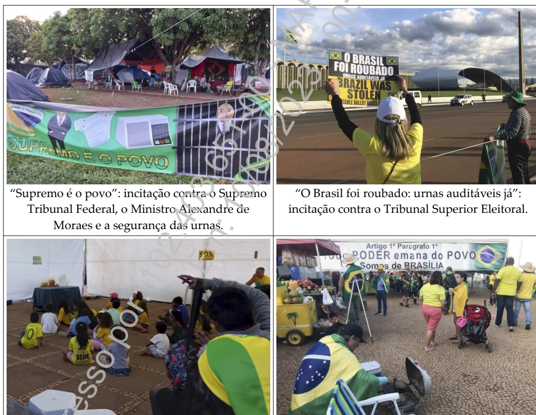
“Supremo é o povo”: incitação contra o Supremo Tribunal Federal, o Ministro Alexandre de Moraes e a segurança das urnas.

denunciada; 2.2) relatório descritivo, ilustrado com fotografias, do acampamento que se instalou nas imediações; 2.3) fluxo médio diário estimado de pessoas e, também por estimativa, informações a respeito da quantidade de pessoas ininterruptamente acampadas; 2.4) fotos, vídeos e relatórios descritivos do acampamento, a exemplo das imagens abaixo 24 :