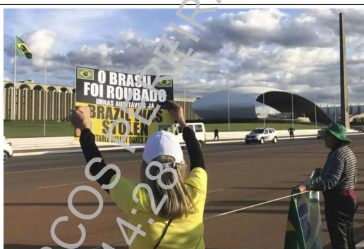
“O Brasil foi roubado: urnas auditáveis já”: incitação contra o Tribunal Superior Eleitoral.