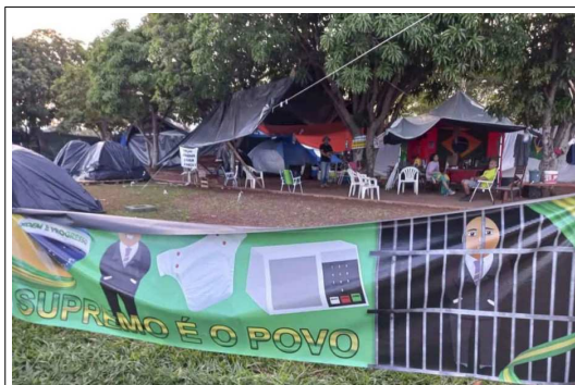
“Supremo é o povo”: incitação contra o Supremo Tribunal Federal, o Ministro Alexandre de Moraes e a segurança das urnas.