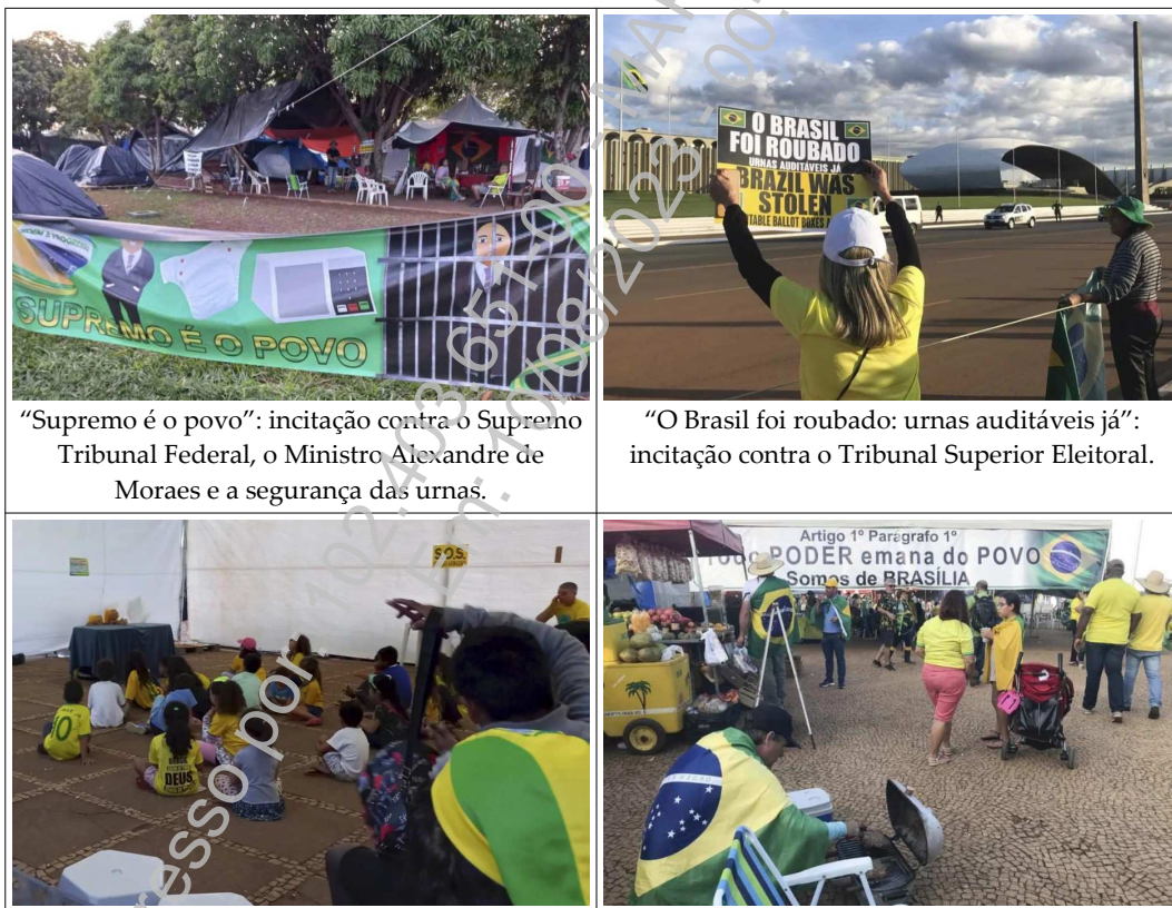
“Supremo é o povo”: incitação contra o Supremo Tribunal Federal, o Ministro Alexandre de Moraes e a segurança das urnas.

denunciada; 2.2) relatório descritivo, ilustrado com fotografias, do acampamento que se instalou nas imediações; 2.3) fluxo médio diário estimado de pessoas e, também por estimativa, informações a respeito da quantidade de pessoas ininterruptamente acampadas; 2.4) fotos, vídeos e relatórios descritivos do acampamento, a exemplo das imagens abaixo 24 :