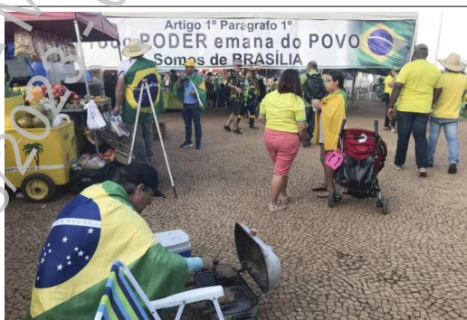
“Todo PODER emana do POVO”: a pretexto de reproduzir texto da CF, incita as Forças Armadas contra o Poder Judiciário.

No mesmo sentido, faixas hostilizando Ministros do Supremo Tribunal Federal 25 e/ou pedindo a “intervenção federal” 26 27 :