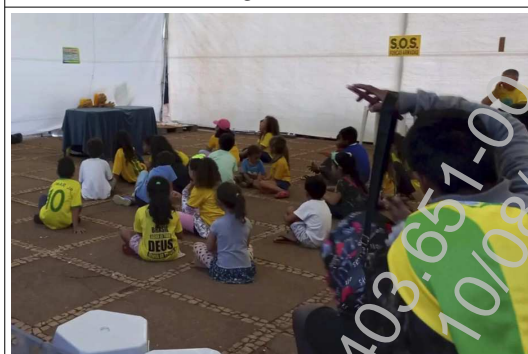
“S.O.S Forças Armadas”: incitação às Forças Armadas para tomada do poder.