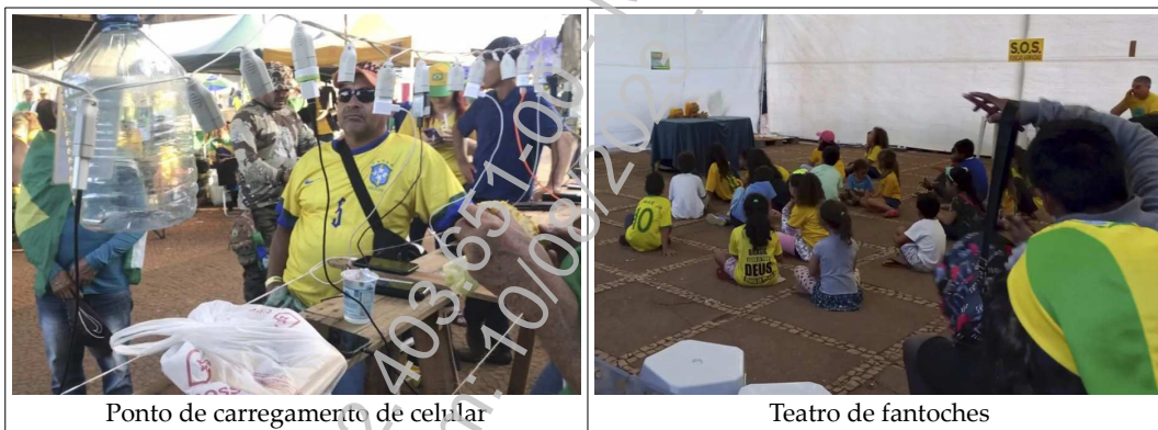
Ponto de carregamento de celular

A estabilidade e a permanência da associação formada por aqueles que acampam em frente ao quartel são comprovadas, de forma clara, pela perenidade do acampamento, que já funcionava como uma espécie de vila, com local para refeições, feira, transporte, atendimento médico, sala para teatro de fantoches, massoterapia, carregamento de aparelhos eletrônicos, recebimento de doações, reuniões, como demonstram as imagens abaixo 1 :